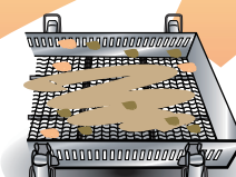
ハム製造/ くん製用カゴ (肉タンパク)