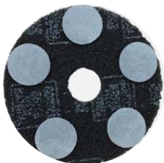
15インチパット 5枚使用