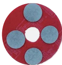
13インチパット 4枚使用