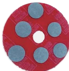
17インチパット 6枚使用