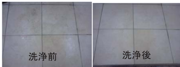
セラミックタイルエンボスタイプ